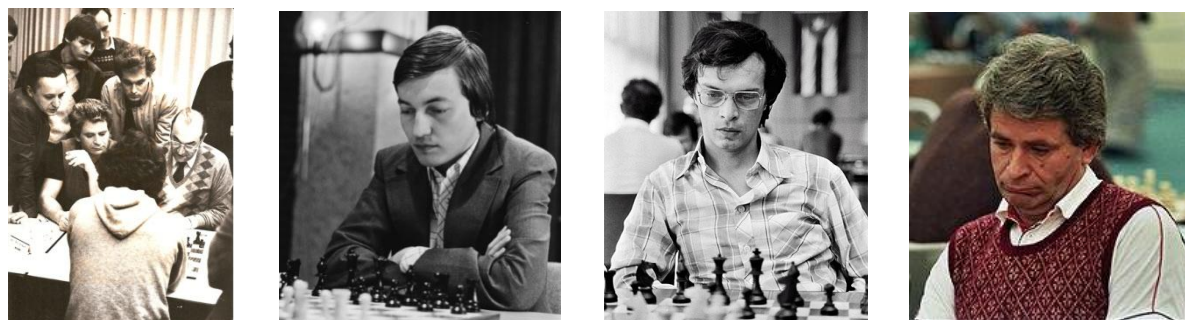
Gheorghiu, Spasski, Kortchnoi, Nunn (1° foto), Karpov, Sax, Spasski