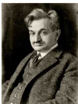
Emanuel Lasker 1919

1919: Emanuel Lasker gioca una simultanea contro una 20a di giocatori vincendole tutte. Il CSL lo onora con un diploma al quale Lasker risponde con una lettera manoscritta di ringraziamento.