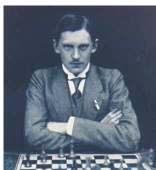
Alexander Aljechine 1922